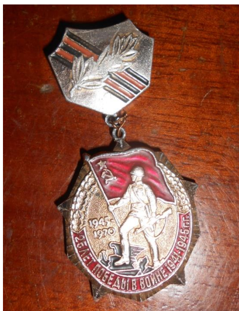
Медаль 25 лет победы в войне 1941-1945.