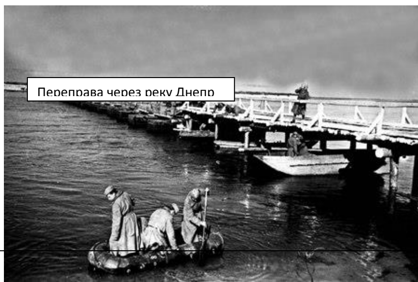
Переправа через реку Днепр

(командующий генерал армии Н. Ф. Ватутин) и Юго-Западного (командующий генерал армии Р. Я. Малиновский) фронтов, захватив 23 плацдарма. От противника почти полностью